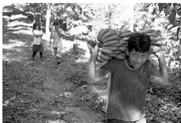
Er en avhengig av et noen få råvarer, som bananer, stiller en dårlig på det internasjonale markedet.

Det er ganske komplisert å forklare hvorfor land er fattige. Det er kan være ulike årsaker, og det er ikke alltid ekspertene er enige om hva som er viktigst.