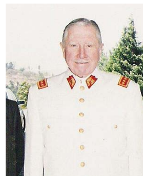
Gustavo Pinochet: En Søramerikansk militarist.