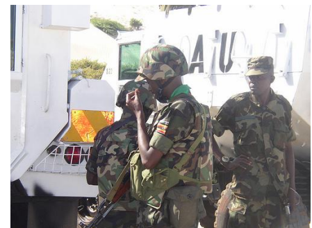
Fredstyrker fra African Union i Somalia.

Krigen i Somalia er først og fremst en borgerkrig, men det er også flere internasjonale aktører involvert. I svaret på spørsmålet " Hvorfor blir det krig? " kan du lese mer om borgerkriger. Svært mange av de punktene du finner der er aktuelle for å forstå litt av krigen i Somalia. Særlig svake stater. Somalia er ofte det første eksempelet enn tenker på når en snakker om "collapsed states". Det har ikke eksistert en fungerende sentral statsmakt i Somalia siden 1991. At konflikten er institusjonalisert er også et viktig poeng, det er mange soldater og ledere som lever av sine våpen i Somalia. Hva krigen handler om har tilsynelatende endret seg ganske mye siden konflikten begynte på 80-tallet.